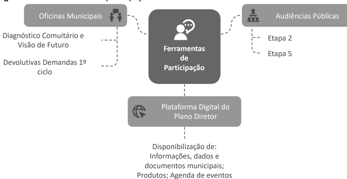
Figura 3.2-1: Ferramentas da participação social

Diante da importância do processo participativo nas diversas fases do projeto, serão promovidas estratégias (vide Figura 3.2-1 ) com vistas a assegurar a participação da população, de modo a fomentar a corresponsabilidade da comunidade local com o resultado do trabalho a ser desenvolvido.